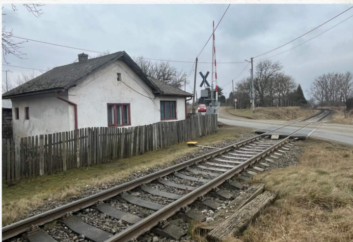
Železničný prejazd cez trať v Nižnej Šebastovej vybudovanú v čase vojnovnej Slovenskej republiky.

Stavba tejto železnice bola dávnou požiadavkou obyvateľov východných krajov, no, nemohli sa dožiť splnenia svojich túžob. Stalo sa tak až v samostatnom, svojskom štáte, že slovenská vláda slovenskému východu vybudovala túto potrebnú železnicu, ktorá vedie vo vodorovnej osi Šariša a Zemplína, spojuje sever i juh Zemplína a juhovýchodnú časť Šariša s Prešovom a tak s ostatným Slovenskom a je súčasne základom pre ďalšie doplnenie železničnej siete nášho východu.