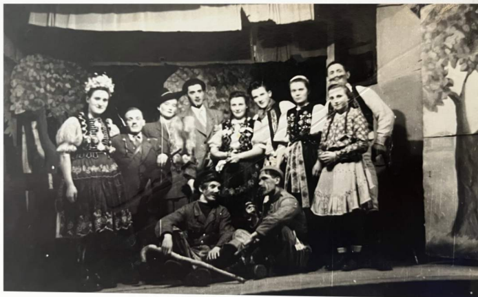
Šebastovskí divadelní ochotníci na scéne.

z popudu miestnej školskej správy zahrli dňa 21. apríla „Kocúrkovo“ od J. Chalupku. Kus tento nemal by chybovať na „repertoári“ ochotníckych krúžkov najmä u nás na vých. Slovensku. Maďarizačný tlak bol u nás najväčší. Výsledok toho tlaku je badateľný na prvý pohľad. Náš nevedomý ľud snažil sa napodobniť čo najviac svojich utlačovateľov, pánov, odkukal od nich nielen rôzne, slovenskému duchu sa priechiace zvyky, ale dokonca začal odvrhovať svoju vlastnú materinskú reč a počal „mondokovať“, ponevač mu bolo vsugerované, že reč a zvyky utlačateľov sú niečím krajším, vyšším, no a predovšetkým „pánskejším“. Dnes sa musíme snažiť prinavrátiť ľud, svoju vlastnú krv, svojskému, našskému životu, mravom, reči, musíme povznášať pri tom i jeho kultúrnu úroveň. Na to slúži predovšetkým škola, za ktorou hneď nasleduje divadlo. A práve spomenutý divadelný kus je dielom, ktoré satirou šľahá tak kultúrnu zaostalosť, povzbudzujúc k pokroku, vzdelaniu, ako i odsudzuje maďarčenie v našom dedinskom a malomestskom živote.