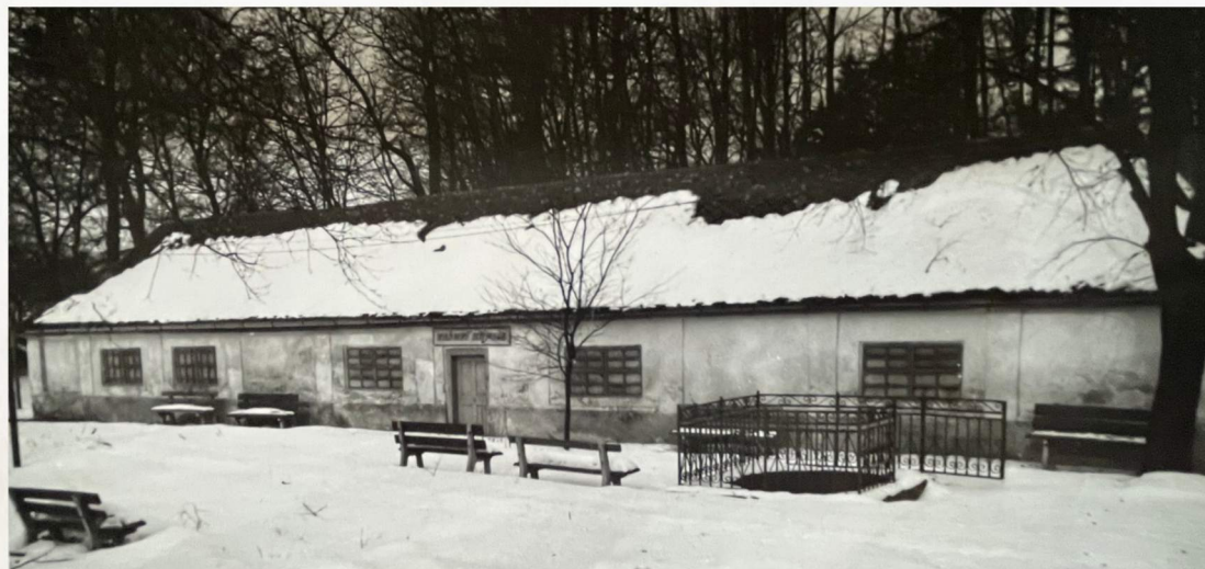
Historické budovy a zariadenia v niekdajšom areáli vaňových kúpeľov Išľa.