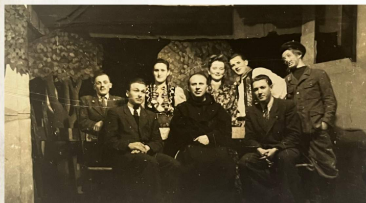
Šebastovskí divadelní ochotníci po predstavení.